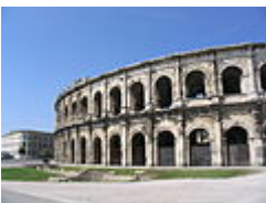
Амфитеатр в Ниме