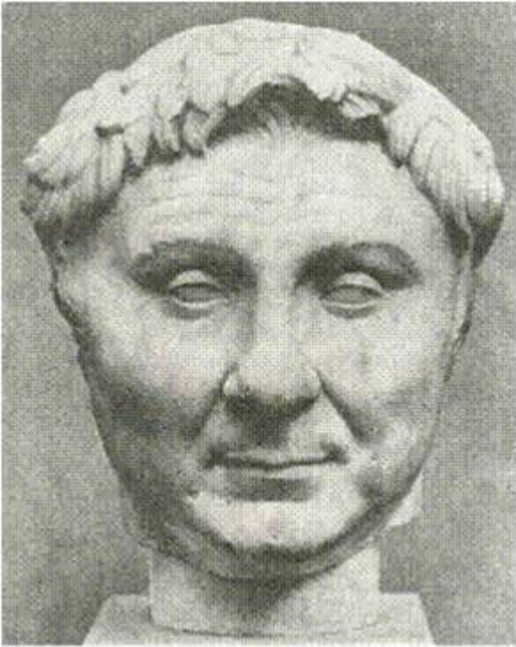
Портрет Помпея. I в. до н. э. Копенгаген. Нью-Карлсбергская глинтотека.

С развитием общественной жизни и ростом роли полководца-завоевателя, государственного деятеля в Риме появляется не только надгробная, но и светская скульптура. Эта скульптура представляет собой почетную статую римлянина закутанного в тогу.