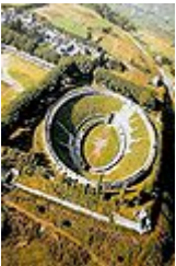
Амфитеатр в Помпеях